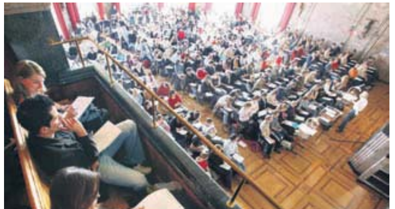
Bei den Stipendien ist keiner gleich: Studierende an der Universität Zürich.

Der Föderalismus treibt manchmal seltsame Blüten. Eine 22-jährige Universitätsstudentin beantragt Stipendien. Ihre Eltern haben ein steuerbares Einkommen von 60 000 Franken und kein Vermögen. Sie hat ein Bruder in Ausbildung und wohnt in ihrer eigenen Wohnung. Würden ihre Eltern im Kanton Zürich wohnen, erhielte sie keine Stipendien. Wäre der elterliche Wohnkanton Luzern, erhielte sie immerhin 4268 Franken jährlich, allerdings ein Viertel davon als Darlehen. Zug würde sich am spendabelsten zeigen: Die Studentin erhielte dort 13 800 Franken im Jahr.