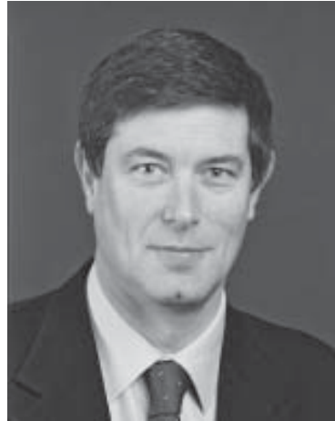
Mauro Dell'Ambrogio Staatssekretär Bildung und Forschung SBF